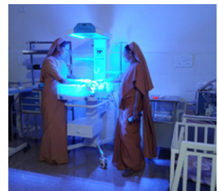
Medizinische Versorgung von Neugeborenen

Dringende Hilfe ist immer noch auf medizinischem Gebiet erforderlich: Wir benötigen noch mehr Mittel, um eine Arztstelle zu finanzieren, damit zumindest eine Grundversorgung gewährleistet ist.