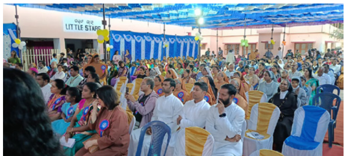
Festakt zum 25-jährigen Bestehen des Infant Jesus Children's Home