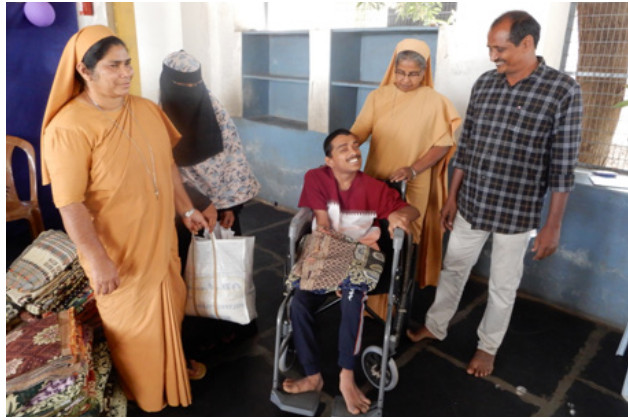
Die Schwestern kümmern sich um Kinder mit Epilepsie

In der Provinz Vimala haben die Schwestern sich vorgenommen, aus Anlass des 50. Todestages von Schwester Petra Präsenzprogramme mit Menschen zu gestalten, die in ihrem Leben alle Hoffnung verloren haben. Dies mag aufgrund von schweren Krankheiten, Schulden, Armut oder Ausbeutung geschehen sein.