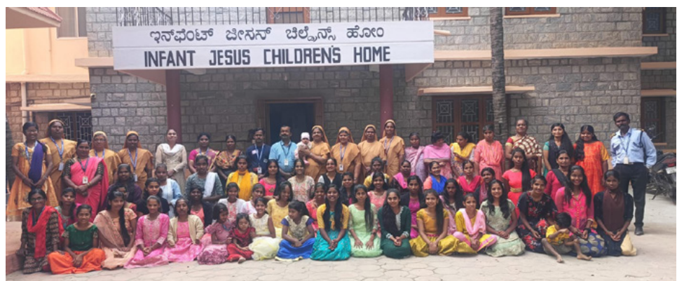
DSS-Schwestern mit den Kindern und jugendlichen Bewohnern des Hauses