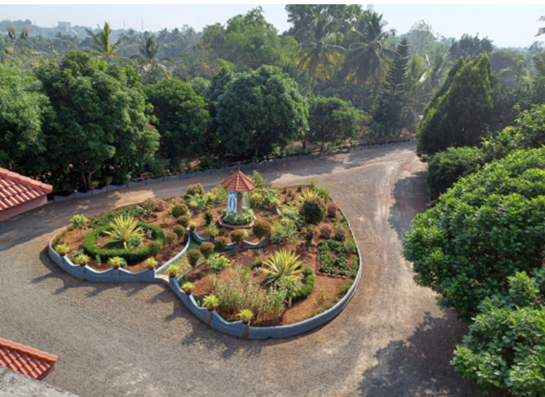
Blick vom Dach des Generalates in Pattuvam