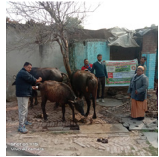
Dorf in Amal Jyothi

Obwohl die Provinz Amal Jyothi weniger Schwestern aufweist, ist sie ein wichtiger Fokus des Ordens. Sie deckt sechs nördliche Bundesstaaten ab. Hier liegt das Augenmerk auf kleinen Dörfern, wo die Entwicklung und die grundsätzlichen Voraussetzungen für ein menschenwürdiges Leben noch sehr zurückgeblieben sind.