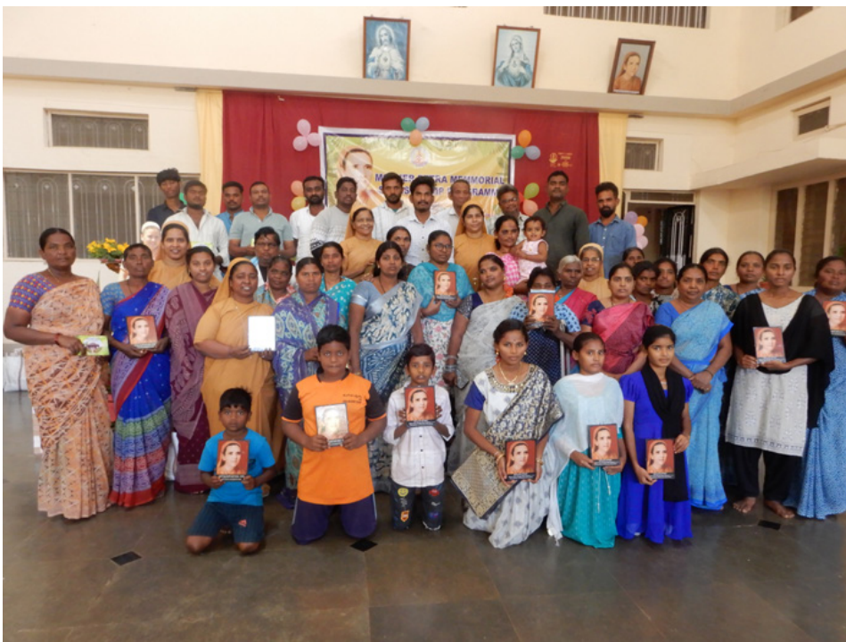
Durch das Programm „Shadow of mercy“ wird die Verantwortung für Kinder mit Epilepsie auf viele Schultern verteilt